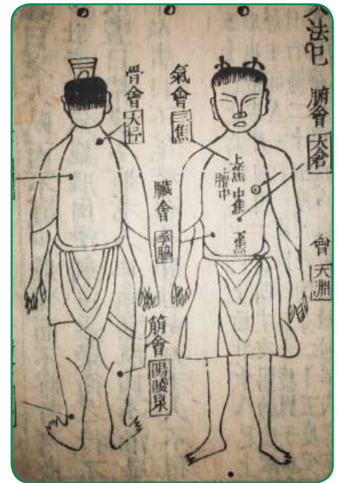
Antico libro di Medicina Tradizionale Cinese

armonico con le variazioni legate alla sua età o agli eventi della sua esistenza e ai ritmi stagionali. ■